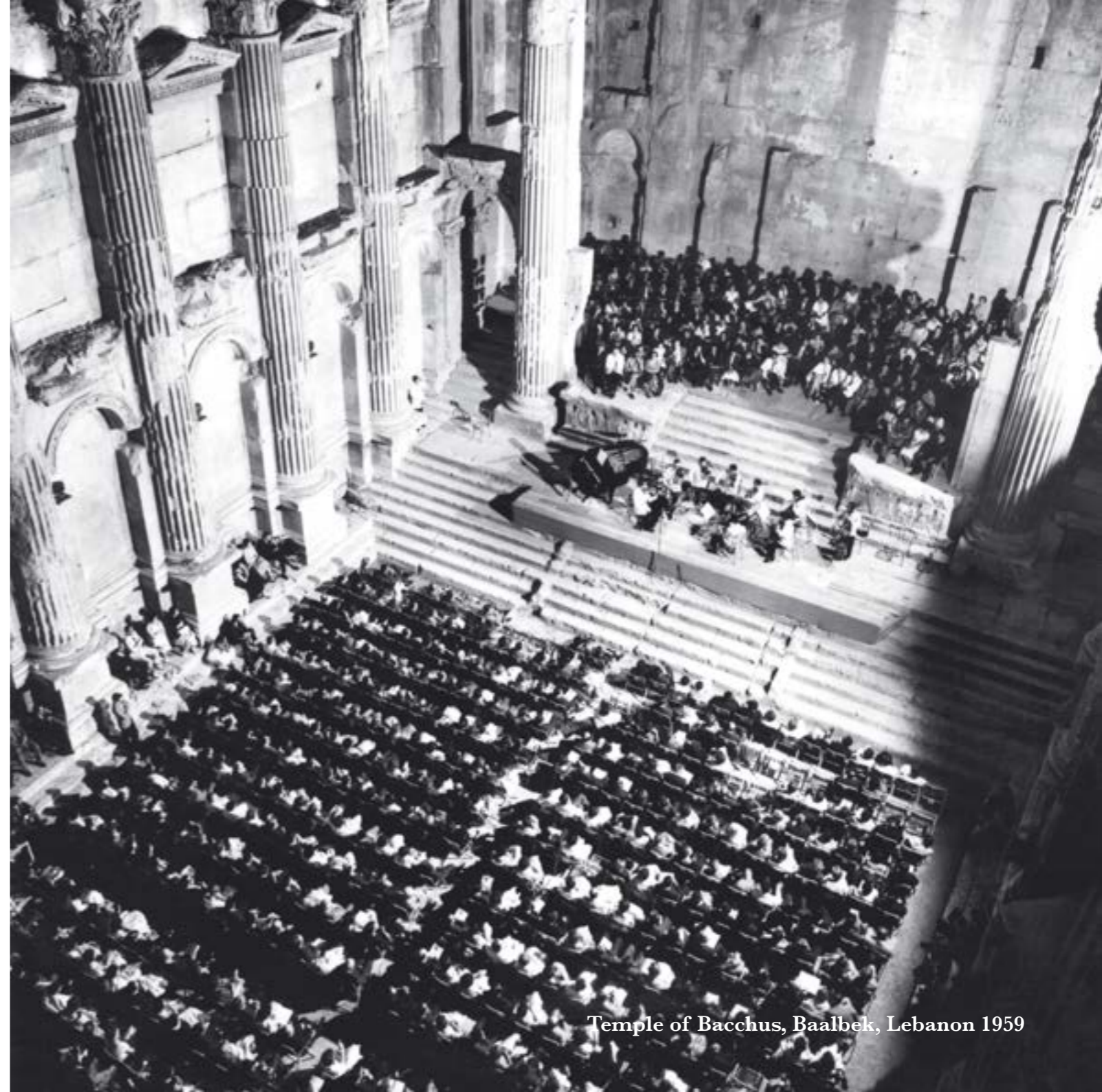
Temple of Bacchus, Baalbek, Lebanon 1959